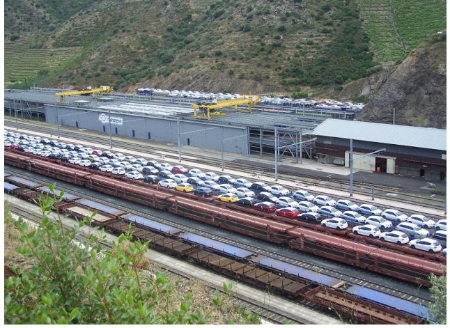
septembre 2009 JP Lasserre du Rozel