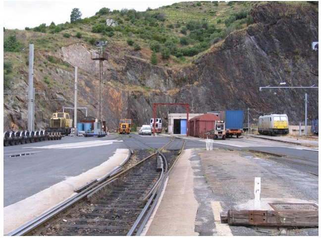
Juin 2011 M.Fourment