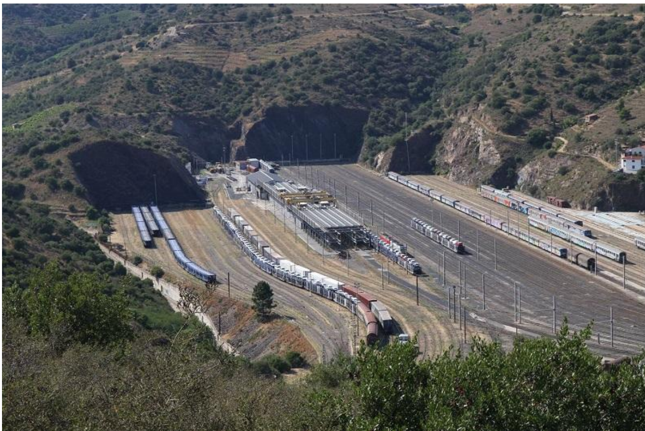
Cerbere 4.7.22 (13)

Trésorier: Eric FONTAINE 30, rue du Salat – 31850 MONTRABE - Téléphone: 05 34 26 97 52 - Mail: ericssalat30@orange.fr